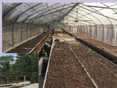
Hanoi Mountain Coffee